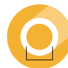
5.2 F 0,044" - 1,12 mm diámetro interno